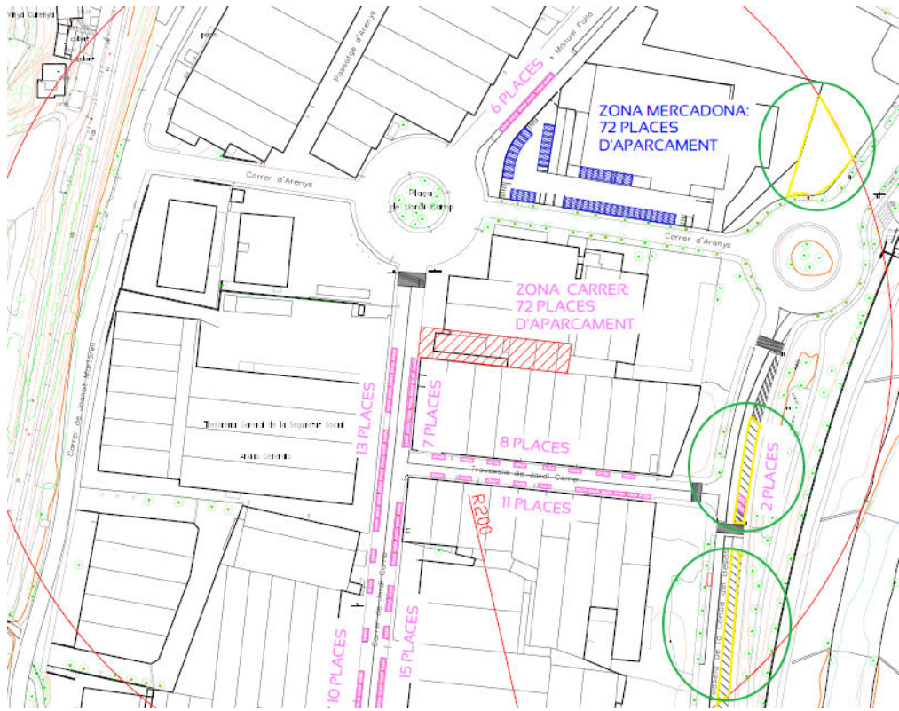
Diferents zones de places d'aparcament de vehicles disponibles en cas d'ocupació

→ S'adjunta plànol amb la disposició de les 72 places vinculades en l'aparcament de l'activitat Mercadona, situada a menys de 200 m, on s'utilitzaran les places exteriors de l'aparcament, i les places interiors. S'adjunta també un contracte de vinculació en les consideracions establerts en l'apartat d), de l'article 135 del POUM.